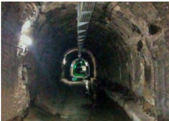
Túnel de serveis de Vallvidrera, estat actual.

Som una plataforma ciutadana amb una proposta molt senzilla: volem que s'habiliti l'ús ciclista dels Túnel de Vallvidrera per tal de connectar el Vallès Occidental amb Barcelona travessant el massís de Collserola en un temps similar al cotxe però de forma saludable, sostenible i econòmica.