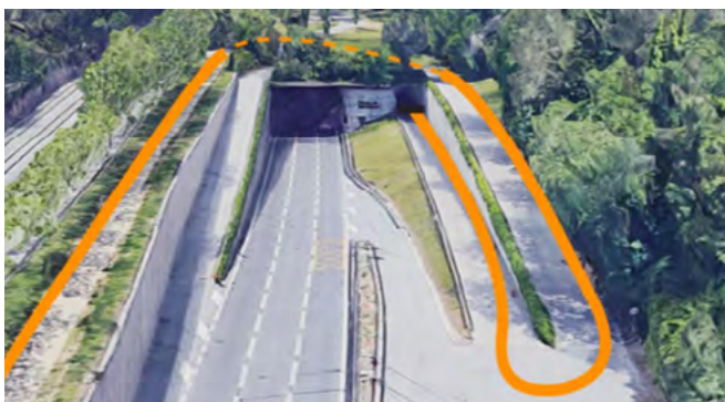
Connexió al vial pedalable existent a tocar de la boca nord