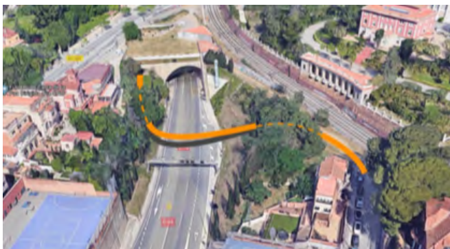
Possible connexió entre el carrer Granados i el túnel de serveis