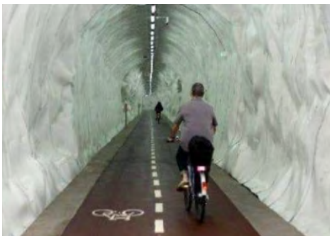
Túnel ciclista de Morlans, Donosti.

Creiem que facilitar l'ús ciclista els Túnel de Vallvidrera oferirà una alternativa al cotxe i la moto i ajudaria a descongestionar el transport públic per fer-lo més eficient, avui més necessari que mai. Només cal acabar de concretar la viabilitat tècnica del projecte, reservar una partida pressupostària minsa i una bona dosis de voluntat política. Però d'això últim estem convençuts que en sobra arreu.