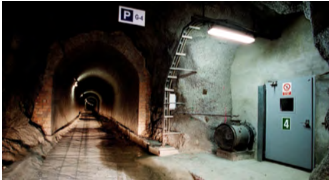
Detalls de l'estat del túnel de serveis

A falta de concretar un projecte tècnic detallat, la connexió pedalable que proposem implementar a través d'un bici túnel es concreta en 3 àmbits: